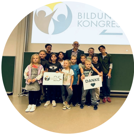
Bildungskongress in Wien 2025 mit Joe Murray - WFD Präsident