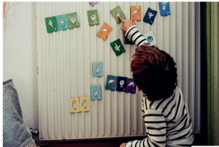
ORF - Licht ins Dunkel 27/02/2025

In Österreich leben rund 450.000 Menschen mit einer Hörbeeinträchtigung, die ihnen die Kommunikation mit anderen erschwert. 8.000-10.000 davon sind gehörlos. Sie verständigen sich in der Österreichischen Gebärdensprache (ÖGS). Die Gesamtzahl der Nutzerinnen und Nutzer wird auf zirka 20.000 geschätzt. Erst seit 2005 ist ÖGS in der österreichischen Verfassung als Sprache anerkannt. Wie jede vollwertige Sprache verfügt sie über eine eigene Grammatik und Satzbau, die sich vom gesprochenen und geschriebenen Deutsch unterscheiden. ÖGS bildet einen wichtigen Bestandteil der Kultur innerhalb der Gehörlosengemeinschaft.